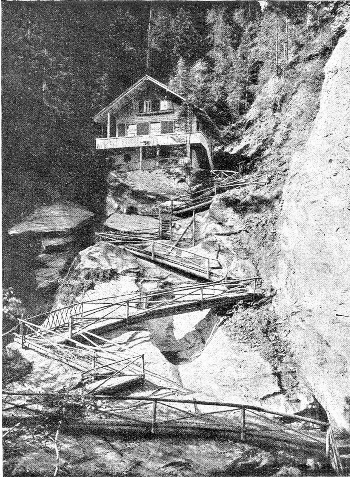
Die Wallbachschlucht bei Lenk (ehemaliger Zustand).

wie die Serben und Bulgaren (als Analogie zu den germanischen Eindringlingen in Italien und Gallien einige Jahrhunderte früher) sich mit Waffengewalt in enger gewordenen Reichsräumen festsetzten und wohl oder übel schließlich geduldet werden mußten. Besonders bedrohlich, aber vorübergehend, war der arabische Ansturm, der den neubegründeten Islam bis an die Mauern Konstantinopels branden ließ. Es ist heute noch unerklärlich, daß sich damals das morsche, rissige Gefüge des arabischen, begeisterungsvollen Ungeheuers, wenn auch mit schweren Gebieteinbußen, einigermaßen zu erwehren vermochte.