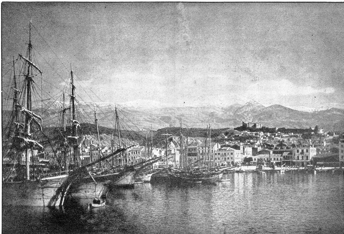
Der Hafen von Patras.