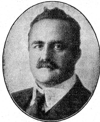
Professor Dr. Max Huber,

Der Ständerat diskutierte viel über das Gesetz für Jagd und Vogelschutz, das auch erledigt wurde und auch über das Zollgesetz. Bei letzterem mußten der Kommission eine ganze Reihe von Artikeln nochmals zur Prüfung übergeben werden, da besonders der deutsche Text äußerst mangelhaft war. Zum Schluß wurden noch einige Petitionen behandelt und Arbeitslosenfürsorge- und Versicherung in Zustimmung zum Nationalrate erledigt. Hierauf vertrugen sich beide Räte bis zur am 1. Dezember beginnenden Wintersession.