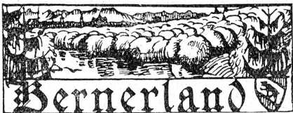
† Dr. Eduard von Werdt.

Nach einer Frist von 14 Jahren seit dem eidgenössischen Unteroffiziersfest in St. Gallen finden 1925 in Zug die 23. Schweizerischen Unteroffizierstage statt. Sie stützen sich auf ein neues Reglement, das auf die Prinzipien und Erfahrungen des modernen Kampfverfahrens und der fortgeschrittenen Spezialisierung der Waffengattungen aufgebaut ist. Angesichts der einzigartigen Bedeutung der Unteroffizierstage für die geistige und körperliche Ertüchtigung des Schweizerischen Unteroffizierskorps haben verschiedene Regierungen wie Aargau, Appenzell A.-Rh., Waadt, namhafte Subventionen zugesprochen. —