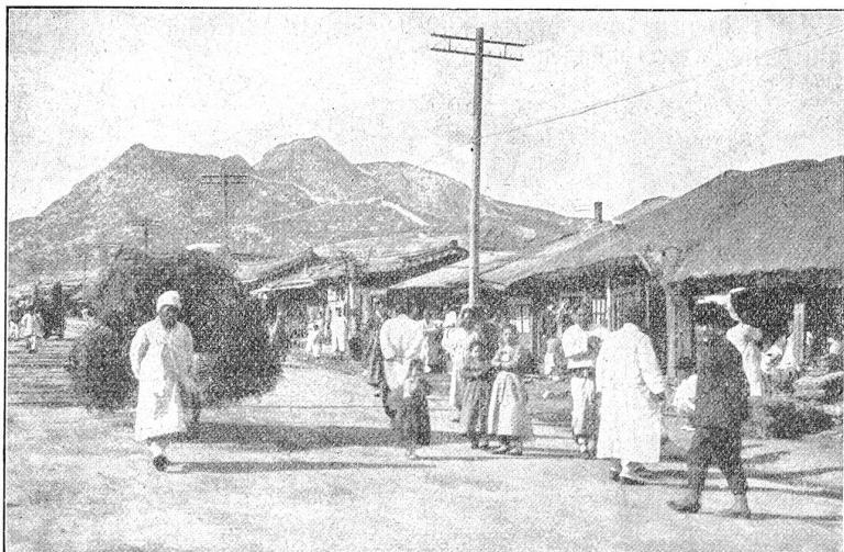
Neu angelegte Strasse in Kejo.

I gangen uf 's zue und fahr im über's Hoor: „Kei Wätter meh, seisch? Wollwoll, lue nummen einisch!“ 's puht mit em Fürtchzipfeli d'Augen uus und luegt a Himmel ue. Und derno luegt's mi wider a, wie wenn 's mi