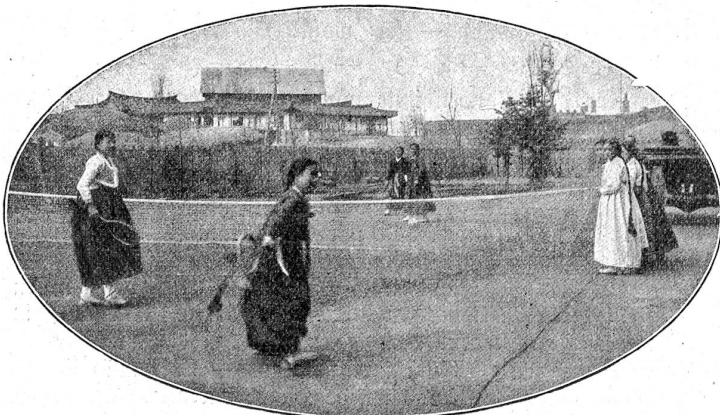
Auf dem Tennisplatz der Mädchenhochschule in Hejo.

Weshalb war mir vorher kalt, und weshalb jetzt so heiß? Die Antwort scheint leicht. Es war doch kalt im Zimmer, da war ich kalt geworden; und als es heiß wurde, da wurde ich warm. Und doch ist das nicht richtig. Denn wenn ich mit dem Thermometer gemessen hätte, würde ich gefunden haben, daß meine Körpertemperatur in beiden Fällen dieselbe war, etwa 37° C. Gestern maß ich mit dem Thermometer einen Fieberkranken, der vor Frost zähneklappernd in seinem Bette lag und klagte, daß er nicht warm werden könne. Aber seine Körpertemperatur betrug 40°, also sogar 3° über der normalen. Früher maß ich einmal einen Mann, dem schrecklich heiß war, weil er sehr viel Wein getrunken, seine Temperatur war 36°. Was sind das für Widersprüche?