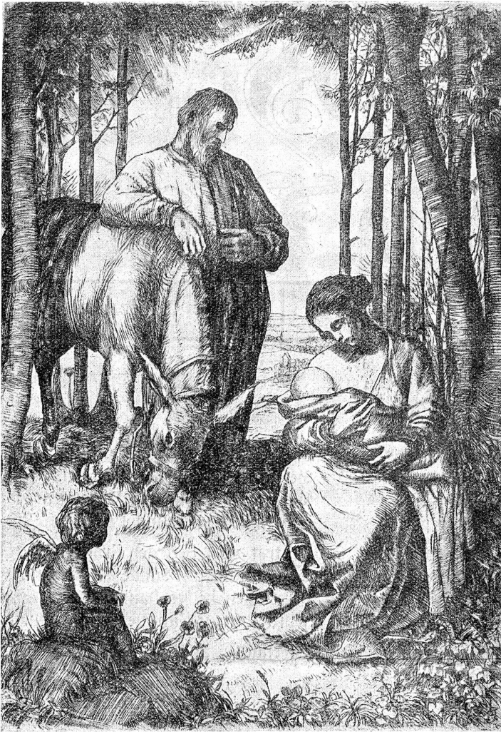
Sigrist: Ruhe auf der Nacht.

macht, die Kolleginnen hatten geflüstert und getuschelt, an vielsagenden Blicken hatte es nicht gefehlt, aber nun kniete Maria draußen auf der Bühne und sprach mit dem Engel, nun saß sie im Stall zu Bethlehem und hielt das Christkindlein auf dem Schoß. O, das Kindlein war ja nur eine Puppe und Maria nur die schwache, hilflose, unglückliche Buchhold. Aber kein Mensch dachte mehr daran, nicht sie selber, nicht die Kolleginnen, nicht die Zuschauer in dem bis zum letzten Platz besetzten Saale. Das war das Jesuskindlein, der Erlöser der Welt, das war Maria, die jungfräuliche Mutter. In den ersten Augenblicken hatte sie noch deutlich gespürt: Zwischen zwei Welten bin ich gestellt, hier auf der Bühne. Hinter mir die Ungläubigen, die Spöttischen, die Hämischen, die Gehässigen, vor mir die Gläubigen, die Hoffenden, die Sehnsüchtigen. Ich zwischen beiden, was wird mir geschehen? Aber dann war sie hineingesunken in das Wort, und aus dem Wort in das Erleben, und aus dem Erleben in das Wesen. Und nun spielte sie nicht mehr, sie war, nur blickartig brach die Wirklichkeit in ihr Bewußtsein. Aber diese Blicke vermochten nicht, ihre nachwandlerische Sicherheit zu erschüttern, ja, in einer Pause, da sie lange nichts zu sagen hatte, ging aus dem Wechsel von Wirklichkeitsgefühl und Traum eine solche helle Wahrheit glückhaft auf, daß ihr die Tränen in die Augen stiegen. Wie hatte sie so schwach sein können