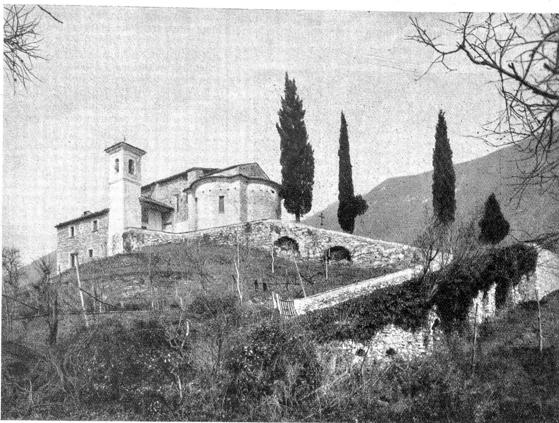
Kirchlein oberhalb Castelsanpietro (Mendrisio). (Zum Aufsatz „Haus und Landschaft im Kanton Tessin“.)