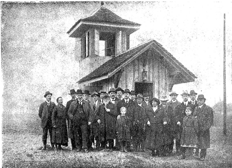
Beobachtungshäuschen der Vogelwarte in Sempach von der Schweiz. Gesellschaft für Vogelkunde und Vogelschutz

Bern aus ihre Tätigkeit bemerkbar gemacht. Die Beringung allein bietet schon ein großes Betätigungsfeld.