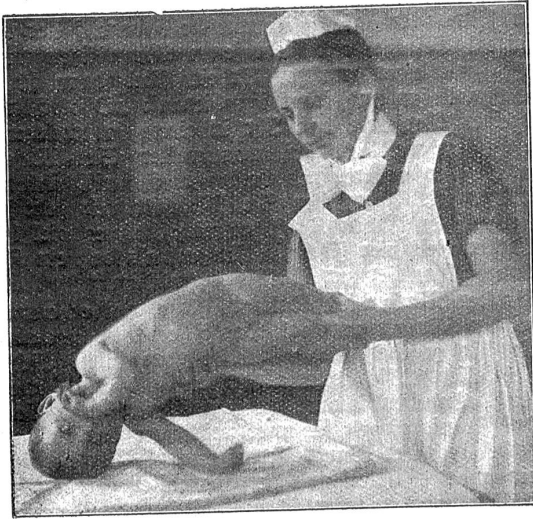
Säuglingsturnen: Bewegungsübungen in der Seitenlage zur Stärkung der Rumpfmuskeln.

Ältere Leserinnen staunen vielleicht über diesen Titel und fragen kopfschüttelnd, manche sogar entsetzt, ob denn