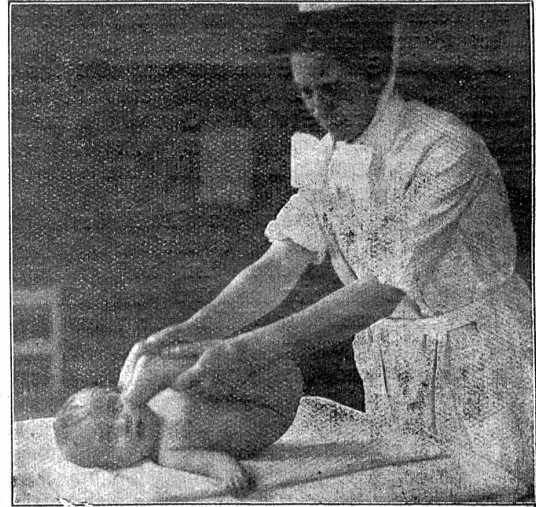
Säuglingsturnen: Bein- und Rippengymnastik zur Vertiefung der Atmung.

Hand mit dem Säugling vorgenommen werden können: Armrollen, Bein- und Fußgymnastik, Hüften- und Rippenbewegung zur Vertiefung der Atmung. Das „Schwimmenlassen“ und das Wurzelbaumschlagen stärken Rücken- und