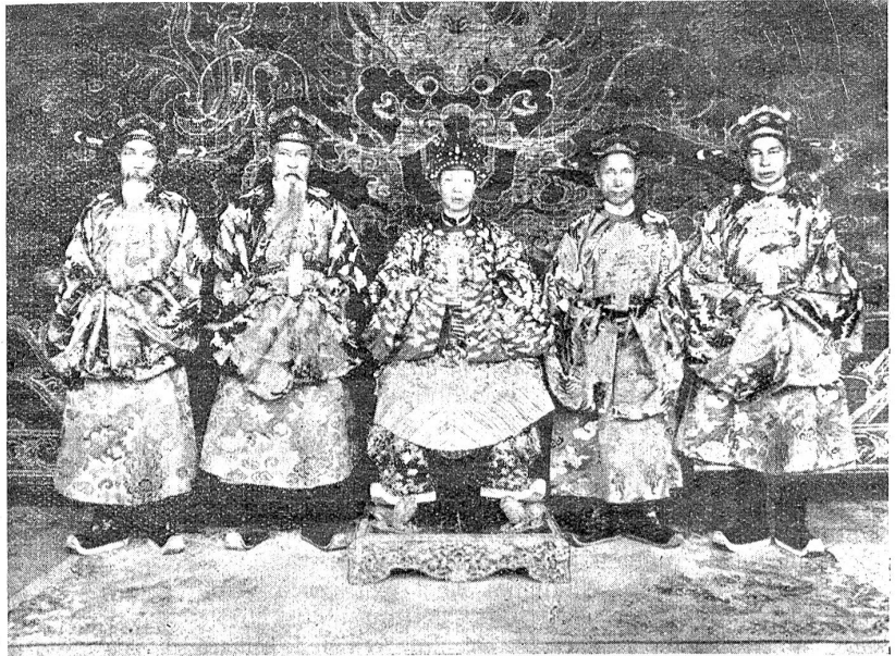
Eine Kabinettsitzung des Kaisers von Annam mit seinen Ministern.

Andererseits möchten die Engländer entgegen dem Wunsche Frankreichs die Sicherheitsfrage nicht mit der Schuldfrage verknüpft wissen. Sie schlagen neuerdings einen englisch-französischen Militärpakt vor, der zunächst die Sicherheit der französischen Kanalfestungen zu garantieren hätte. Zur Verwirklichung der völligen Sicherheit müßte dann auch Deutschland für die Allianz gewonnen werden.