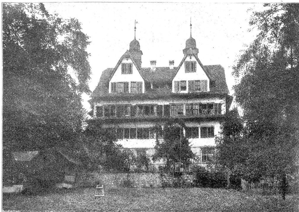
Schwyz. Das Itäl v. Redingsche Familienhaus an der Dorfbachstraße.

Garten, Feld und Wald herumgelaufen wie ihre Geschwister, die braun und glatt aussahen wie Haselnüsse.