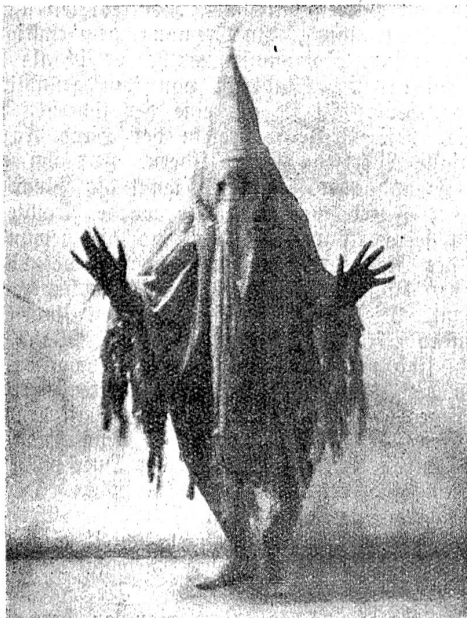
Tanzgastspiel Emmy Sauerbeck: Aus „Canz in Rot“.

Das wirklich gut — allerdings mindestens zur Hälfte von jugendlichen Bubiköpfen — besuchte Theater zeigt von dem regen Interesse, das Bern heute schon für die Ver-