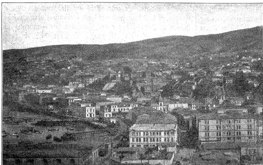
Valparaiso, die grösste Hafenstadt Chiles.

ahnen, daß Bernhard möglicherweise eine Entschuldigung hatte, wenn er sie kalt nannte und ihr vorwarf, sie wisse nicht, was liebhaben heiße.