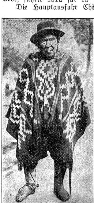
Chile: Ein alter Ranchoero (Bauer) im Sonntagsstaat.

Die Patagonier betreiben eine ausgedehnte Schafzucht. Der Hafen Punto Arenas, die südlichste Stadt der Erde, führte 1912 für 15 Millionen Franken Wolle aus.