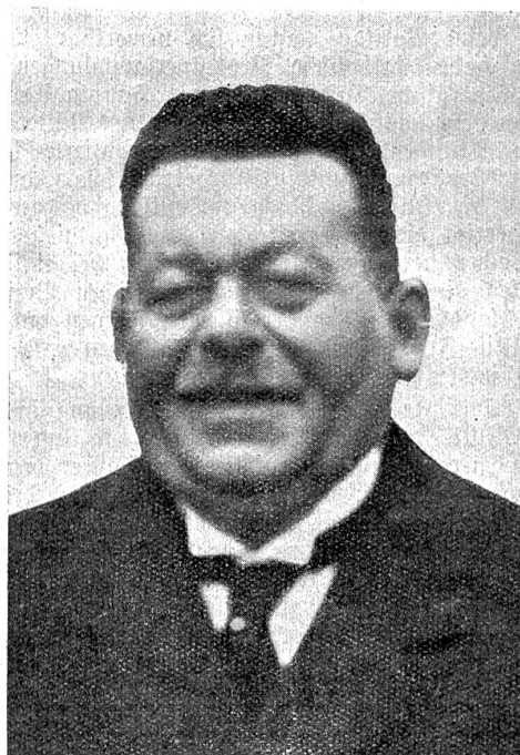
† Fritz Ebert, Deutscher Reichspräsident.

England hat durch den Außenminister Austen Chamberlain etwas über seine europäische Politik verraten lassen.