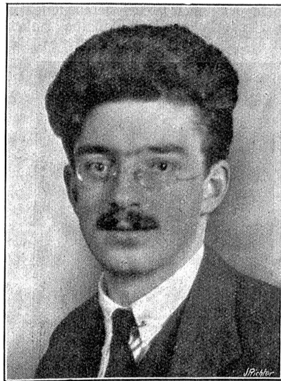
Plinio Bolla, der neue Bundesrichter.

war. Auf diese Weise würden jährlich etwa 5000 Auslandsschweizerkinder zu Schweizerbürgern. Ein Vorbehalt, daß dem dem betreffenden „Muschweizer“ die Möglichkeit gegeben werden müsse, sich späterhin nach eigenem Gutfinden