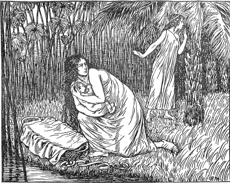
Die Aussetzung des Moses.