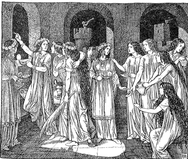
Die klugen und die törichten Jungfrauen.

Wir müssen immerlich ein wenig an uns arbeiten und suchen, milder in unserm Urteil, anspruchsloser in unsern Forderungen zu werden. Wir müssen anfangen, die Leute zu nehmen wie sie sind, und zur Erleichterung der Arbeit immer eingedenk sein, daß es in Nord und Süd, West und Ost immer wieder die alte Geschichte ist, und daß wir selber die Fehler teilen, die wir an andern rügen und verdammen. Theodor Fontana.