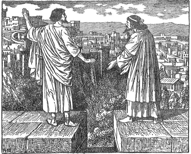
Jesus in der Versuchung.

Mürger kennt die Bibel und die Vorstellungswelt, die die Tradition aus ihr aufgebaut hat. Das beweisen die 80 Illustrationen. Sie verraten auch, daß er sich ein eingehendes Studium der biblischen Landschaft und Kultur nicht verdrießen ließ, um dem Geist der zu illustrierenden Erzählungen ganz gerecht zu werden. Denn auch das Sachliche gehört zum Verständnis des biblischen Geistes. Je vertrauter einem die Dinge sind, umso lieber sind sie einem; und Liebe schafft die Bereitschaft zur Aufnahme des Geistigen, das aus den Dingen strömt. So hat, glauben wir,