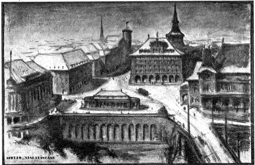
Projekt der Herren Architekten E. Hostettler und H. Pfander, Bern (Perspektive).

Da keine ich ein eisgraues Großmütterlein, dessen Augen noch gar frisch in die Welt blicken trotz der achtzig Jahre, die ihm den Rücken beugen. Sieben haben hat die Frau aufgezogen. Als sie vor einiger Zeit ihren achtzigsten Geburtstag feierte, kamen sie alle zusammen: Männer, wie die Bären so stark, und mit allen sieben geht der Erfolg durchs Leben. Sie sitzen auf großen Gütern,