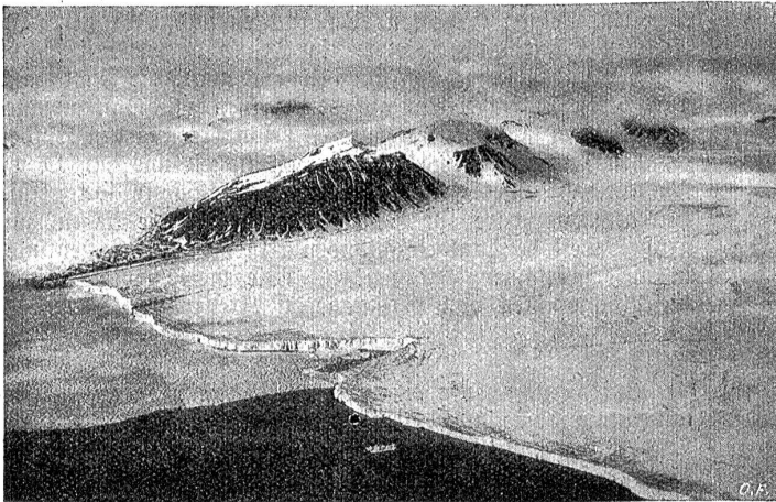
Der Rand des Packeises im nördlichen Eismeer.

Amundsen trat 1918 seine große Nordpolfahrt von Kristiania aus an. Er wollte, wie Nansen, vom Beringsmeer her zum Pol vorstoßen. Er hatte aber mit seiner Expedition wenig Glück. Im Sommer 1918 gelangte Amundsens Schiff „Maud“ etwa bis zum Kap Tscheljustin, dem nördlichsten Punkt Asiens. Hier mußte er überwintern, kam erst im Hochsommer 1919 wieder frei, gelangte aber in diesem Sommer noch glücklich über das Nordensjøldmeer und durch die enge Durchfahrt zwischen den Neusibirischen Inseln und dem asiatischen Festland. Nun stieß Amundsen nach Nordosten vor, um die für sein Einfrieren in Aussicht genommene Gegend zu erreichen, kam aber bald an eine Eisbarriere, die ihn statt nach Norden nach Südosten zur Anjouninsel an der ostsibirischen Küste östlich der Kolymamündung führte. Hier erfolgte die zweite Ueberwinterung, 1919 auf 1920.