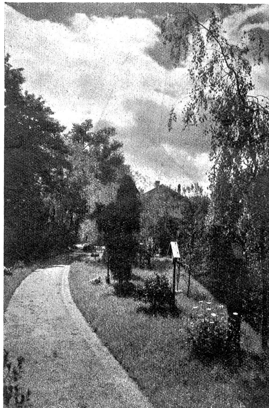
Sriedhofsausstellung Bern, Juni—September 1925 (Bremgartenfriedhof). Ländlicher Sriedhof.

an Klärchen. Da der Nachmittag am Sinken war und es kühl wurde, waren ihre Finger steif und ungeschickt. Aber