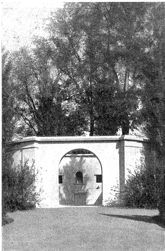
Friedhofsausstellung Bern, Juni—September 1925 (Bremgartenfriedhof). Kolumbarium.

Susanna für sie tun? Womit konnte sie ihr Andenken ehren? Wie es vor dem Vergessen retten? Darüber dachte sie