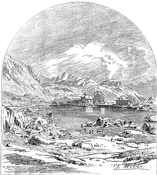
Das St. Gotthard-Hospiz.

nacheinander die folgenden Uebergänge stark begangen worden sind: der Brenner als direkteste Verbindungslinie zwischen Verona (Venedig) und München, im Westen der Große St. Bernhard, dann der Mont Cenis. In der zweiten Hälfte des 12. Jahrhunderts dominiert der Septimer. Aber nach 1197/98 wird wieder der Brenner der deutsche Paß nach Italien. Der Gotthard fällt völlig aus dem Spiel, die Schöllenen war im 12. Jahrhundert zweifellos noch nicht geöffnet.