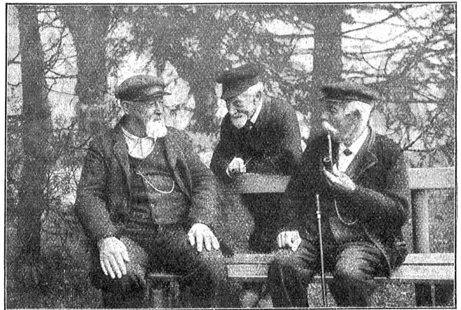
„Und druf abe hani gseit . . .“

Ich hatte gedacht, daß mein Entschluß feststünde und hatte nur einen Weg vor mir gesehen, der führte in die Heimat und in den Lehrerberuf, in ein Leben voll mühsamer, wenn auch reichlicher Arbeit für meine Mutter und meine Schwester. Und nun kam dies Anerbieten, riß die Tore auf und zeigte mir lockend eine Welt voll Glanz und Schimmer. Sorglos studieren dürfen und dann ein Leben „auf der Menschheit sonnigen Höhen“! Ich war jung, und das Künstlertum in mir war stark und machte