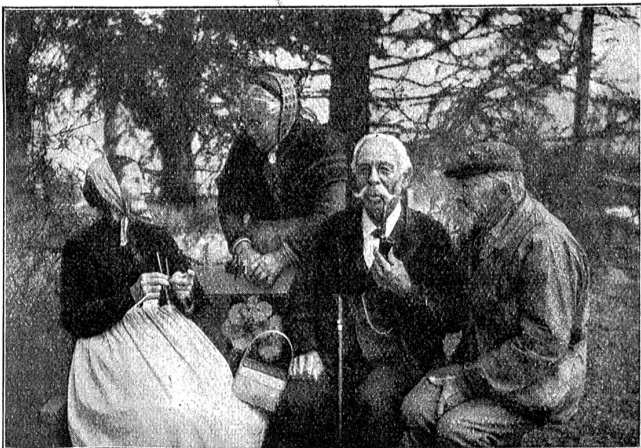
„Mir längwilen-is nid.“

Wenn ich jetzt auf mein Leben zurückblide, so weiß