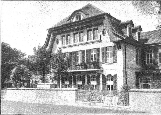
Neuer Mittelbau des Greisenasyls Bern.