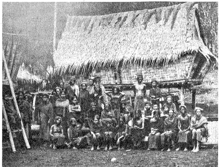
Bevölkerung eines Malayenkampong.