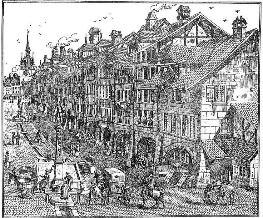
Die Spitalgasse, Schattseite mit dem Davidsbrunnen um die Mitte des 18. Jahrhunderts.

„Wir haben mit Fleiß dies Haus gebaut, Dabei auf Gottes Hilf' und Segen getraut. Wir machten es stark aus Holz und Stein Und bauten drei fromme Wünsche hinein: Der erste heißt: Langes Leben darin: Der zweite: Gesundheit und fröhlicher Sinn, Der dritte heißt: Lebt treu und recht, Ein Beispiel kommendem Geschlecht, Und zwingt euch der Tod das Leben ab, Und müßt hinunter ihr ins Grab, So mög' man euer treu gedenken Und Gott euch seine Ruhe schenken.“