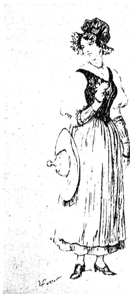
Waadtländerin in ihrer Tracht.

Besondere Beachtung verdient die Gruppe Obst- und Weinbau. Ebenso der Pavillon über Bienenzucht. Die rühmlichen Beileger aus allen Gauen unseres Landes bieten mit viel Geschmac ihr Bestes. Einen mächtigen Eindruck hinter-