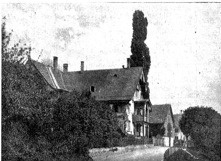
Zum 100. Geburtstag Conrad Ferdinand Meyers. Conrad Ferdinand Meyers Haus an der alten Landstraße in Kiltberg.