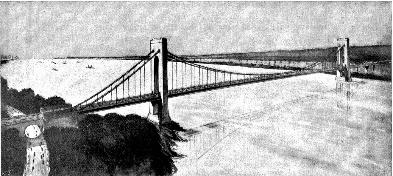
Die vom Schweizer Ingenieur O. B. Ammann in New York projektierte Riesenhängebrücke über den Hudson-River. (Spannweite 1036 m, Höhe der 33 m breiten Brücke über dem Wasserpiegel 64 m, der Pfeiler 210 m, Kosten 35 Millionen Dollars.)