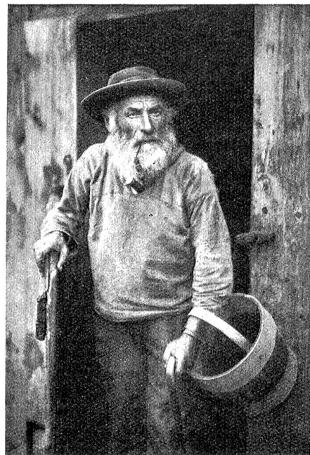
Ein wahrer Schäbentaler.

Ähnlich erging es mit den älteren Schongesetzen für Gemsen und anderes Großwild. Selbst das Raubwild war