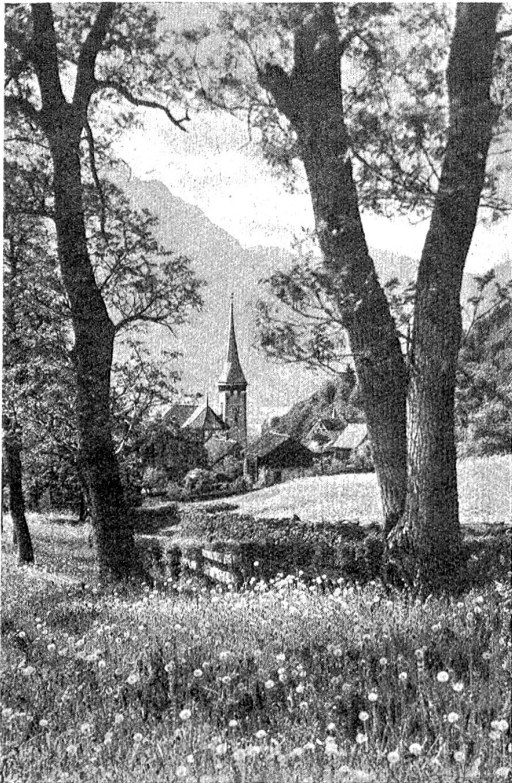
Blick auf Bürglen.

Und keine erhabenen Posen wählen; Was auch an Gedanken die Köpfe durchraspelt, Wenn nur die Seelen nicht gar zu vertapfelt;