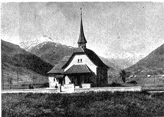
Das protestantische Kirchlein in Andermatt.

Elfe Garrin, schlank und hochaufgeschossen, stand auf einem Stuhl, in der Hand des hochemporgestreckten, linken Armes ein offen herunterhängendes Heft haltend. Und je nach mehr oder minder heftiger Bewegung des schlanken Armes, flatterten weiße, dichtbeschriebene Blätter, flatschten diese an die steifen Dedel des Einbandes.