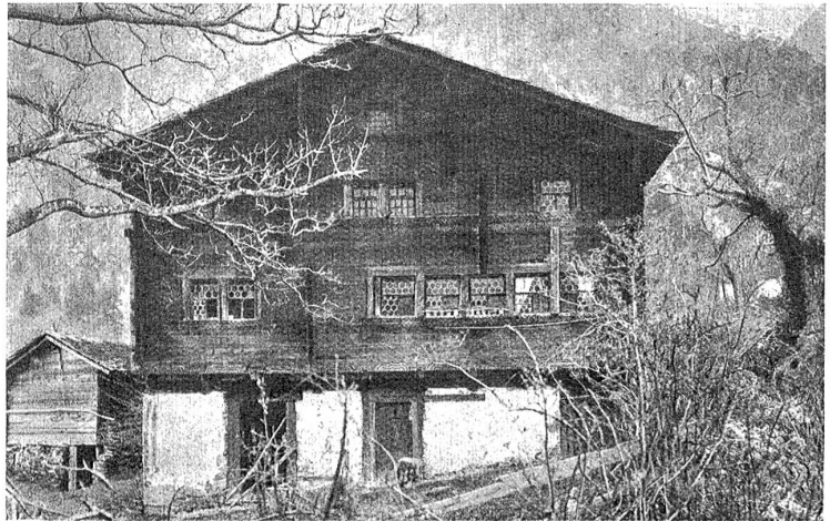
Altes Urnerhaus in Erstfeld.