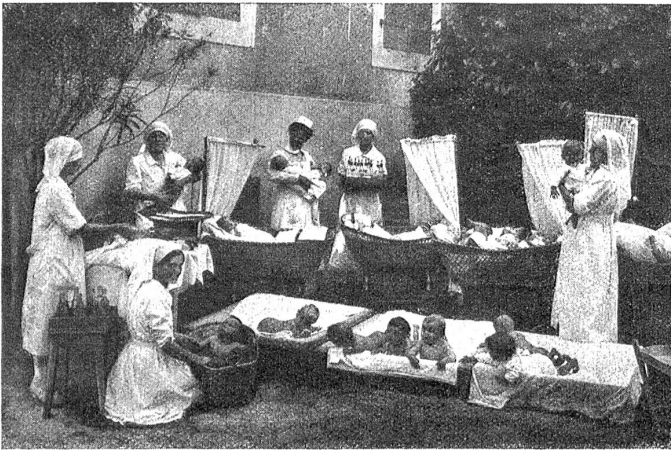
Von der Krippe in Paudex bei Lausanne. Während der schönen Jahreszeit sollen die Kleinen so viel als möglich von der Sonne und Luft profitieren.

Neue kochte in ihm. Da befaß er sich nicht länger, raffte das Mädchen in ihrer nässeklatschenden Seide auf seine Arme und schleppte sich mit seiner Last den Waldhang hinunter, der Straße zu, selber erschöpft und wankenden Schrittes, so daß er sie kaum zu halten vermochte.