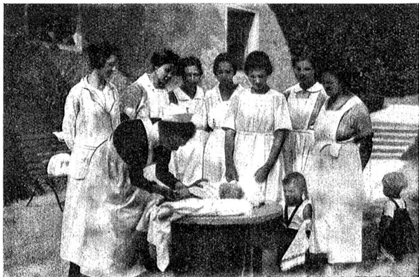
Kinderpflege und hausgeschäfte wollen, wie andere Berufe, gründlich erlernt sein. Beim jungen Mädchen schon beginne die Schulung.

Auf einem schroffen, nur von einer Seite zugänglichen Fels, 750 Meter hoch, zwischen der wilden Schlucht der Moësa und der Talstraße, liegt talbeherrschend die Ruine der Burg Misox, dreißig Kilometer nordöstlich von Bellinzona. Sie ist eine der schönsten und ausgebehntesten Burganlagen der Schweiz, bestehend aus vier mächtigen Ecktürmen, dem Bergfried, Palazzo, der Schloßkapelle S. Car-