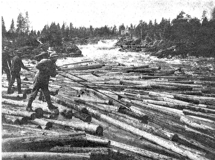
Bilder aus Schweden.

Durch einen zweiten wertvollen Naturschatz ist Nordschweden schon viel früher bekannt geworden, durch seine großen Lager an Eisen- und Kupfererzen. Hoch im Norden liegt bei Gellivara der berühmte Malmborg, einer der erzeichsten Berge der Erde, wo heute in 14 Gruben etwa 2400 Arbeiter beschäftigt werden. Ein zweiter, älterer Grubenbezirk befindet sich im Gebiet des untern Dalefles, in