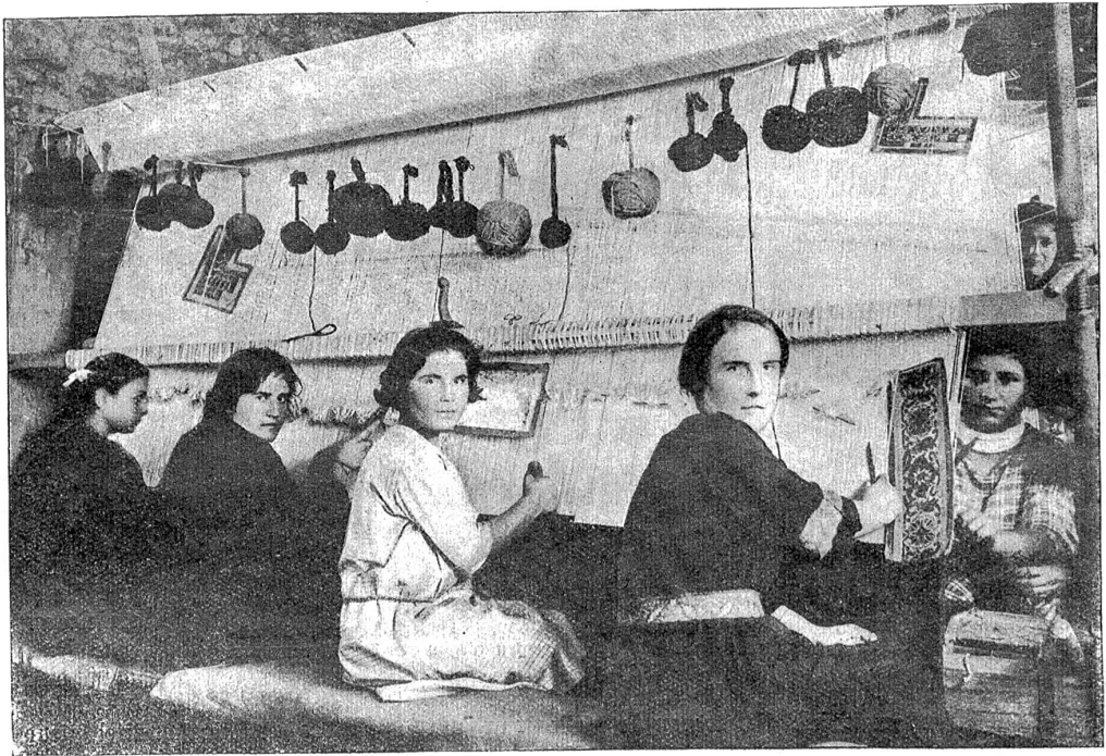
Armenische Mädchen mit der Herstellung von Ceppichen beschäftigt im Waisenhaus von Oropos (Griechenland).