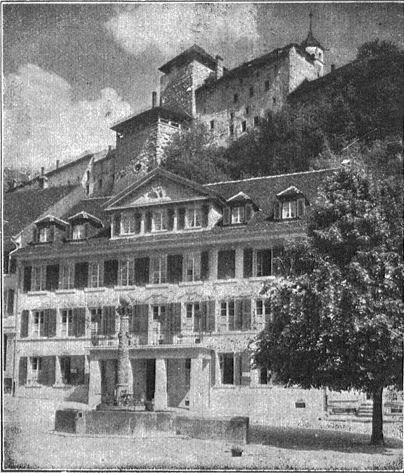
Das neue alkoholfreie Gemeindehaus zum „Bären“ in Aarburg.

ist da im Tramhüttli der Morgen erwarte. — Das Gespräch het mi natürlech nid hert intressiert und ig ha ume probiert