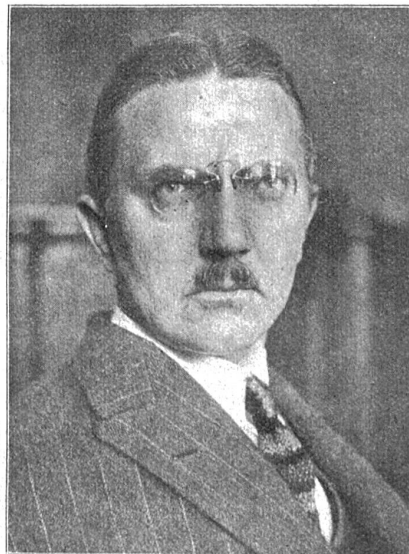
Dr. Hjalmar Schacht, der Direktor der deutschen Reichsbank, Träger der Deflationspolitik, die die gegenwärtige Wirtschaftskrise gebracht hat.

Warschau wird mit dieser Lösung kaum ganz zufrieden sein. Es droht auch schon mit der Abkehr von Genf und mit Anlehnung an Mostau, das natürlich mit freundlichem