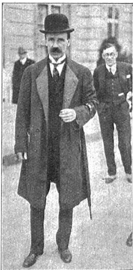
Völkerbundstagung in Genf. Graf Bethlen, der Führer der ungarischen Delegation vor seinem Hotel.