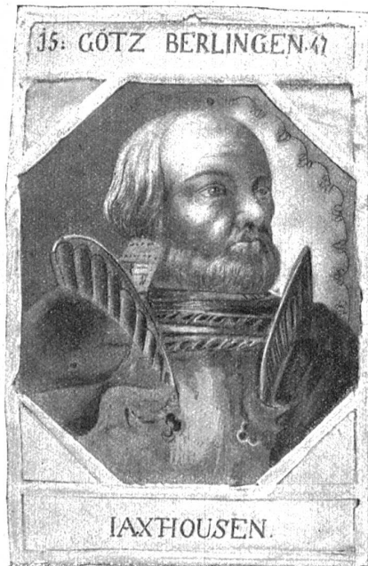
Gemaltes Fenster mit dem Bild Götz von Berlichingens.

Welch heitere Sinnenwelt, welch glückliches Verweilen, Genießen in der sonnigen Gegenwart!