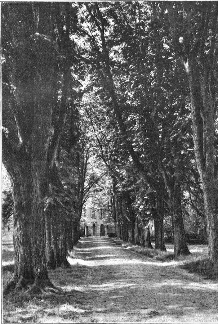
Kastanienallee beim Schloß Höligen.

Die Suhl, durch den langen Regenfall mächtig angeschwollen, tobte und rauschte in ihrem Bett.