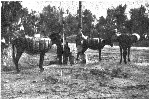
Wasserverkäufer von Sidi Bou Saïd.

Von dem Garten des arabischen Hauses, welches ich bewohne, hat man eine wunderbare Fernsicht auf das Meer. Stundenlang kann ich dort sitzen und ins Weite schauen.