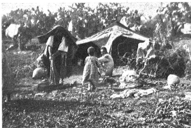
Beduinenzelt in der Umgebung von Sidi Bou Saïd.