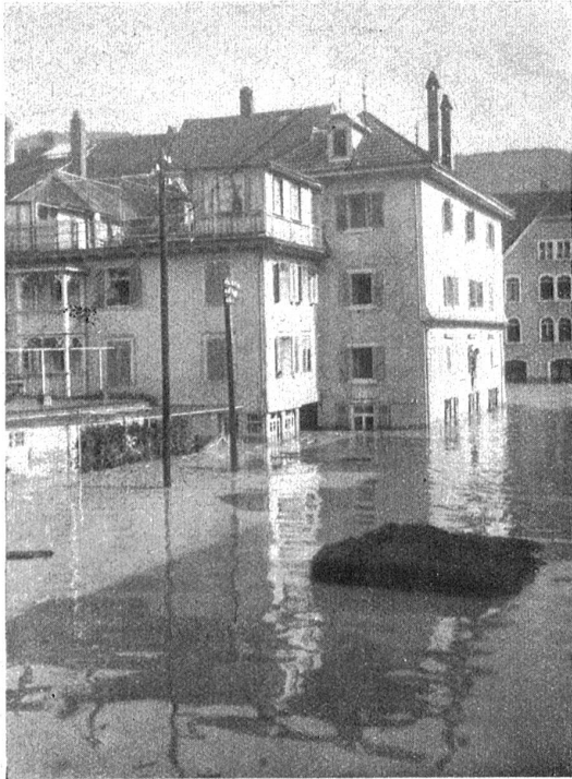
Von der Wetterkatastrophe in Balsthal.

wie sich die Wasser aus dem Bachbett in die teilweise etwas unter dem Straßenniveau gelegenen Wohnungen und Werkstätten ergoß, Türen durchbrach und auf der Vorderseite der