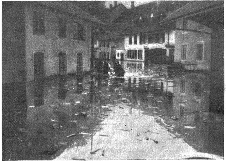
Von der Wetterkatastrophe in Balsthal.

In der Tat: Mussolini ist für die Welt ein Experiment. Diktaturen hat es zu allen Zeiten zur Genüge gegeben;