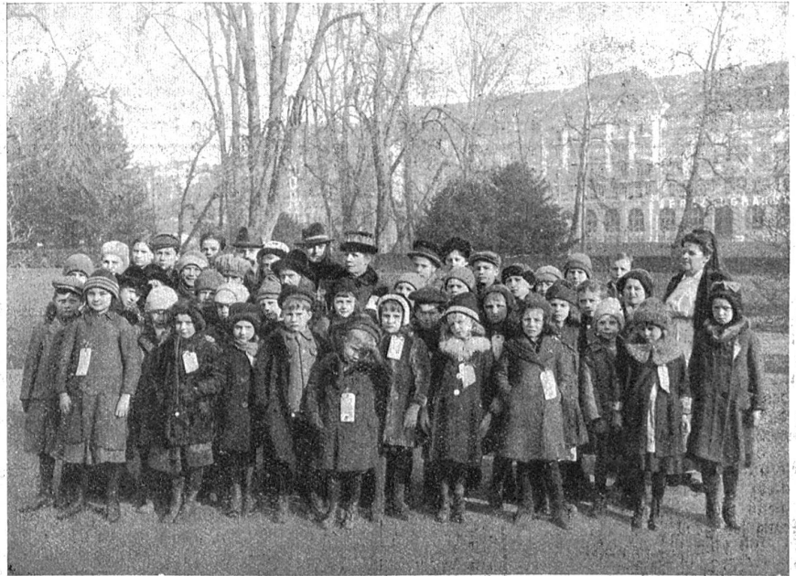
Die ersten Ungarkinder bei ihrer Ankunft in Zürich (Februar 1920).

Morgen Sonntag werden sich in Bümpliz die Nationalturner des Kantons Bern zum Wettkampf zusammenfinden. Es sind über 300 angemeldet, unter denen sich altbewährte Kämpfer befinden, die schon mit Erfolg an eidgenössischen Turnfesten mitgemacht haben. Die Wettkämpfer in Bümpliz verdienen deshalb großes Interesse.