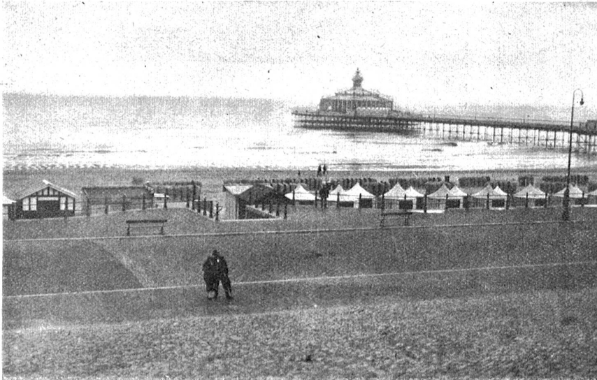
Scheveningen. — Nordseebad.