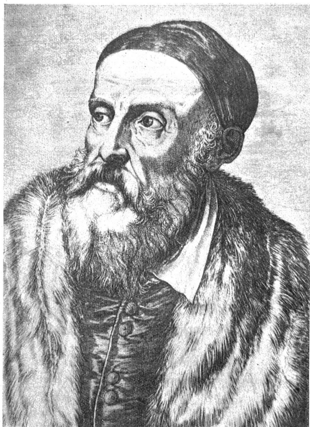
Zu Tizians Codestag am 27. August 1576. Porträt Tizian Vecellio, genannt Tizian.

Am 27. August jährte sich zum 250. Male der Todestag des Tiziano Vecellio, genannt Tizian. Geboren 1477 zu Pieve di Cadore in Triaul, dem Hauptort der Landschaft Cadore am Fuß der Dolomiten, kam Tizian schon in früher Jugend nach Venedig, wo er sich ganz der Kunst hingab. Er fand bei Gentile und Bellini reiche künstlerische Anregung. Mit ihnen und den Zeitgenossen Giorgione und Palma Vecchio bildet Tizian die Gruppe der großen venezianischen Künstler, die Venedigs Ruhm als Kunststadt begründeten. Doch alle diese glänzenden Maler überragt Tizian durch die Vielseitigkeit seines Talentes, die Kraft seiner