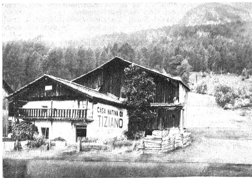
Geburtshaus Tizians zu Pieve di Cadore in Triaul.

Tizian starb am 27. August 1576 im biblischen Alter von 99 Jahren, körperlich rüstig, in geistiger Vollkraft, und daher fortwährend künstlerisch tätig. Er starb an