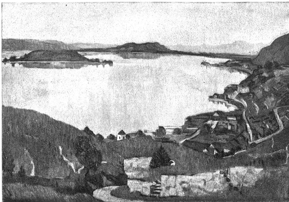
Ernst Geiger, Eigerz. — Blick auf den Bielersee mit der St. Petersinsel und dem Jolimont im Hintergrund.

schlossenen Affenmaterials zu dessen weiterer Vervollständigung schreiten müsse, was auch seinerseits bereits geschehen wäre, wenn die ganze Unternehmung nicht zufolge Unzulänglichkeiten materiellen Charakters eine Interruption erlitten und vorübergehend in eine Phase der Stagnation eingetreten wäre. Mit anderen Worten: er beantrage hiermit im Interesse der beförderlichen weiteren Anhandnahme des Prozesses eine Nachsubvention von nur zweihundert Franken.