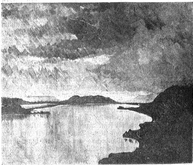
Ernst Geiger, Eigerz. — Bielerseelandschaft.

Ein weißgelockter Alter naht dem Strand Und spannt ein Netz entlang den Pfostenreihen.