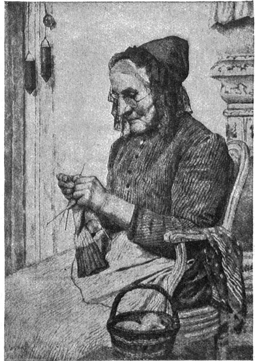
Albert Anker. — Die Großmutter.

dachte, kam ihm das halbvergeffene Sprichwort wieder in den Sinn, das er früher oft von einem Nachbar, dem Serger-Samuel, gehört hatte: „Die Armut frißt dem Glück