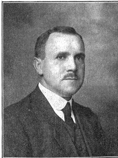
Fritz Joff, bernischer Regierungsrat.

Laut Mitteilung des eidgenössischen Veterinäramtes waren am 12. September in der ganzen Schweiz an Maul- und Klauenseuche verheut: 3547 Stück Rindvieh, 153 Schweine, 1045 Ziegen und 286 Schafe. —