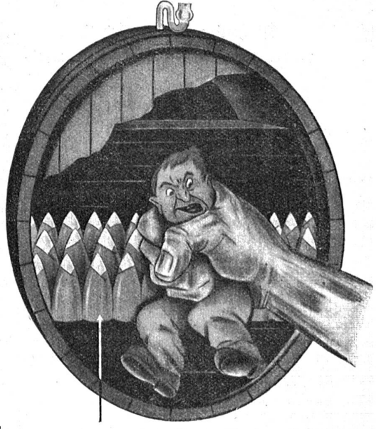
Im Süßmostfaß bleibt durch Ausschaltung des Hefepilzes aller Zucker der Früchte als gesundes, hochwertiges Nahrungsmittel erhalten.

Eine Anzahl gemeinnütziger Vereine der Stadt Bern veranstalten anfangs Oktober einige Süßmost-Tage, an denen auf dem Schulhof an der Speichergasse zu den genannten Preisen Süßmost erhältlich sein wird. Süßmost zum Sterilisieren in der eigenen Küche wird sogar für bloß 40 Cts. abgegeben. Die Käufer haben