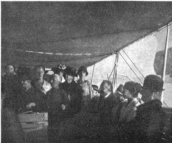
Auf dem Schiff der Alten.

Einen Tag ist das Schiff der Alten auf dem Zürichsee gefahren, einen wundervollen, glanzvollen Tag. Dieser Tag wird fortleuchten in der Erinnerung der in ihr scheidendes Heim Zurückgekehrten und manche einsame, dunkle Stunde erhellen. W. A.