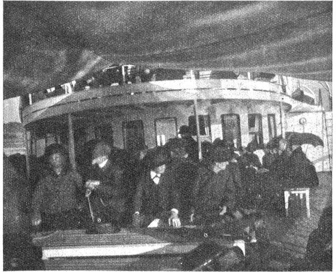
Auf dem Schiff der Alten.

Am Nachmittag laden schattige Bänke zur Raft am Seegegestade ein. Die meisten lockt der Schloßhügel, wo