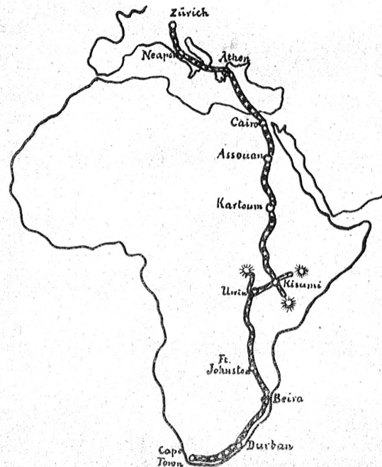
Die Flugroute Mittelholzers.

An photographischen Apparaten ist vorhanden eine Kamera mit Kassette für 120 Platten und automatischem Vor-schub, derart, daß ein Fingerdruck genügt, um den Verschluss zu betätigen, die Platte zu nummerieren und die folgende vor das Objektiv zu bringen. Besonderes Interesse verdient dagegen der nach den speziellen Angaben von Herrn Mittelholzer erstellte Reihenbilderapparat, dessen Objektiv senkrecht abwärts gerichtet ist. Der Apparat selbst ist auf dem Kabineboden aufgestellt und mit Rollfilm 4×9 Zentimeter geladen. Der Verschluss wird nun durch ein kleines Pro-