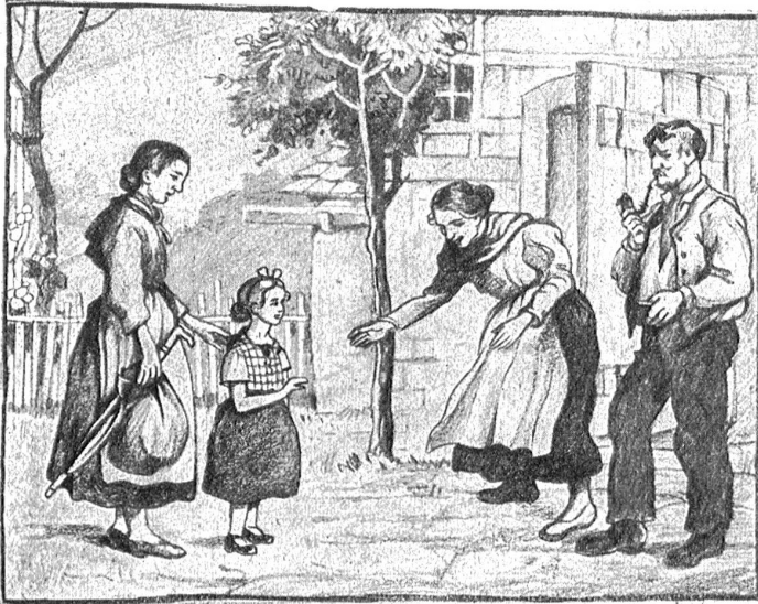
Boscovits: Aufnahme eines Pflegekinde.

Der Ertrag der Dezemberaktion Pro Juventute hilft unter anderem auch mit, daß vielen verlassenen Kindern in guten Pflegefamilien eine neue Lebens- und Erziehungsstätte geboten wird.