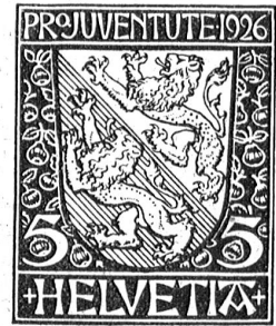
Die vier neuen Pro Juventute-Marken in vierfacher Vergrößerung.

Letztes Jahr wurde für bedürftige Mütter, Säuglinge und Kleinkinder gesammelt; heuer kommt das Geld den Schulkindern und nächstes Jahr den Schülern zu.