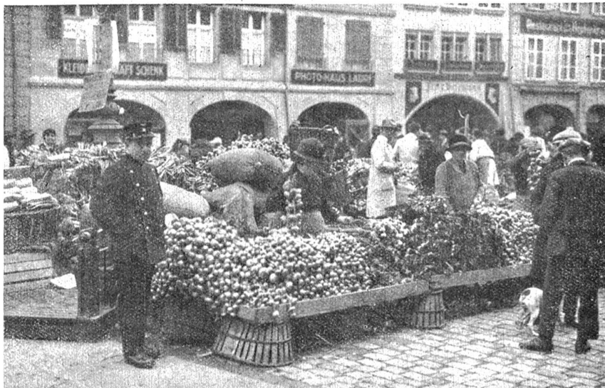
Vom diesjährigen Berner „Ziebelemarkt“.