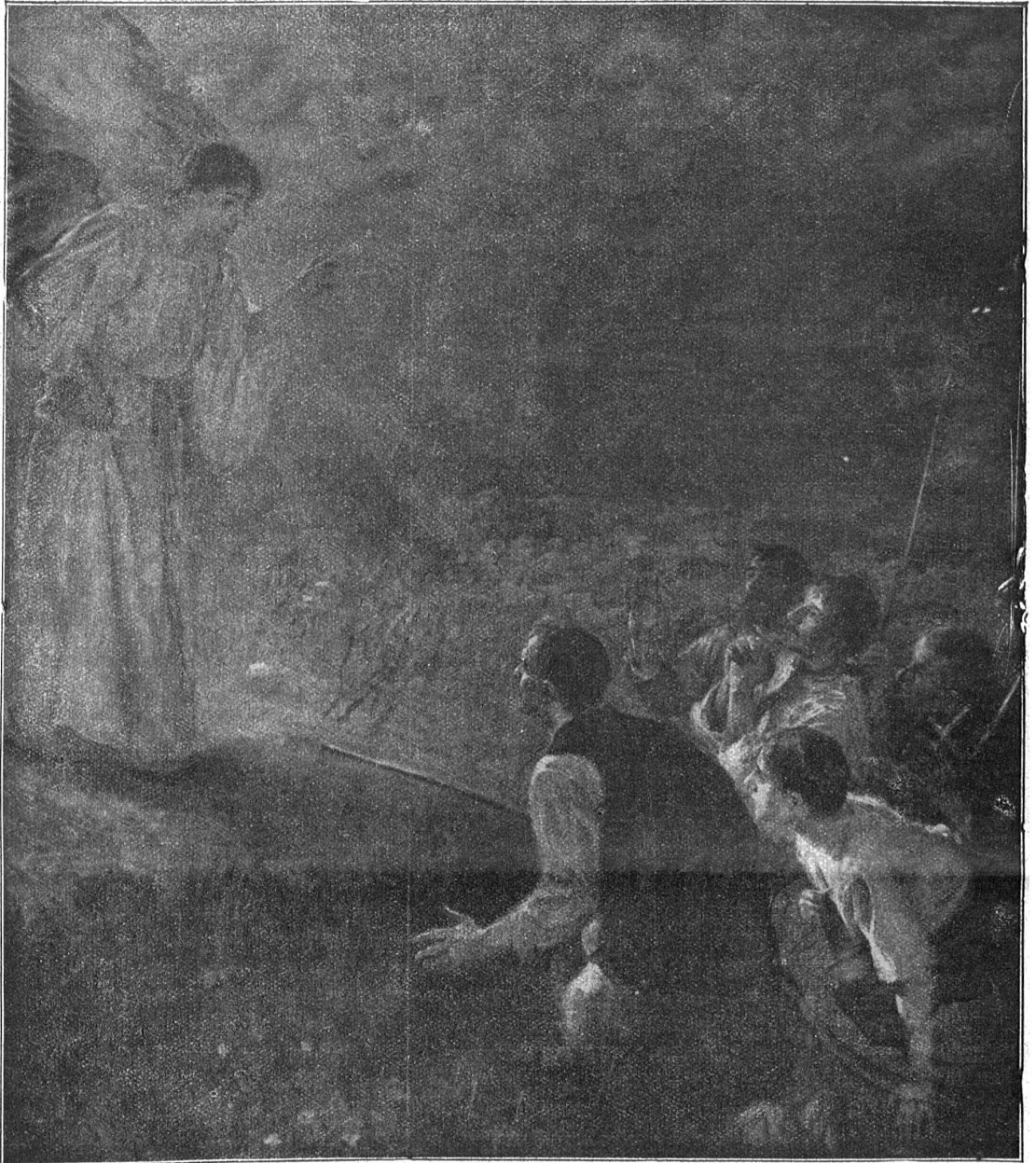
Sris v. Uhde: Verkündigung bei den Hirten.

Sie hatte sich zu ihm auf die Sofalehne gesetzt, und beide lasen nun gemeinschaftlich den beschriebenen Zettel,